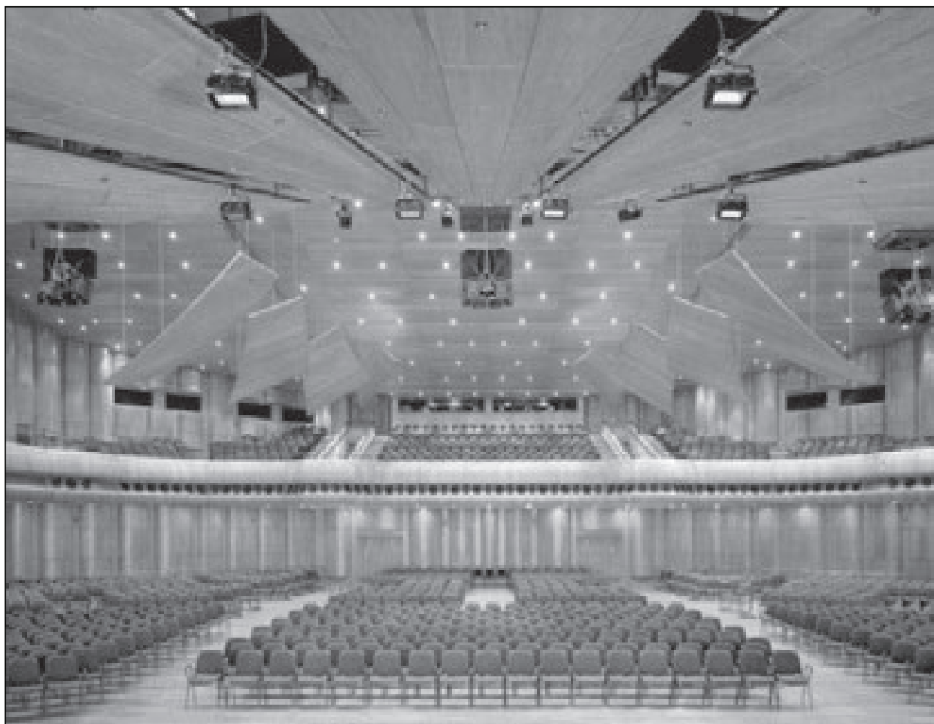
Montreux, auditorium Stravinski Strawin